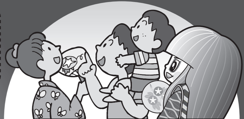
井原市マスコットキャラクター でんちゅうくん