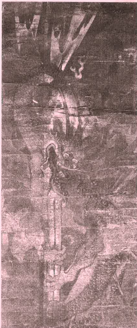
不動明王二童子俱利伽羅龍剣図(部分)