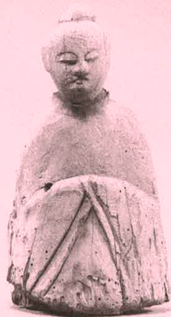
木造若宮神坐像(市指定重要文化財)