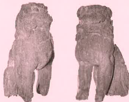
木造狛犬(市指定重要文化財)