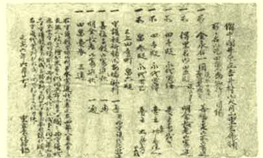
しょうげんじ 文安6年(1449)重玄寺領知行目録 重玄寺所蔵

あしががたかうじ ごだいご 室町幕府を開いた足利尊氏には、後醍醐天皇と決別し九州へ落ちた際に井原に一時とどまったとのエピソードがあります。また尊氏の庶子であり、尊氏と対立した弟・直義の養子直冬とその末裔について、井原や芳井に由緒が伝わっています。この度の展示では尊氏の末裔と井原地方とのかかわりを分かりやすく紹介します。