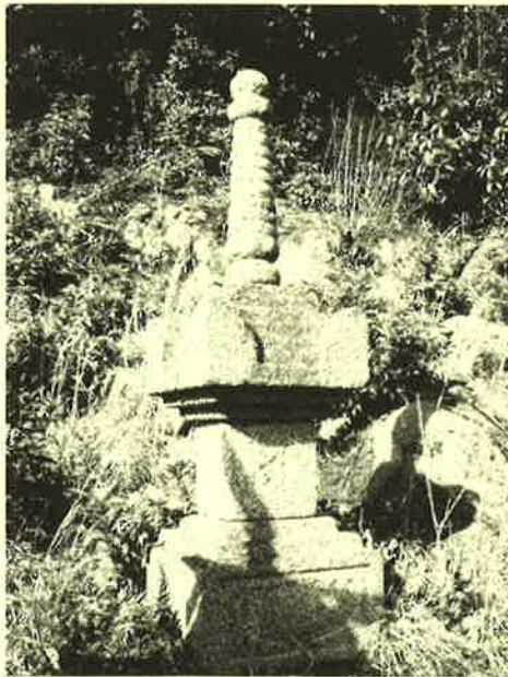
しょううんじ 正雲寺 足利尊氏を供養 すると伝わる宝篋印塔

あしががたかうじ ごだいご 室町幕府を開いた足利尊氏には、後醍醐天皇と決別し九州へ落ちた際に井原に一時とどまったとのエピソードがあります。また尊氏の庶子であり、尊氏と対立した弟・直義の養子直冬とその末裔について、井原や芳井に由緒が伝わっています。この度の展示では尊氏の末裔と井原地方とのかかわりを分かりやすく紹介します。