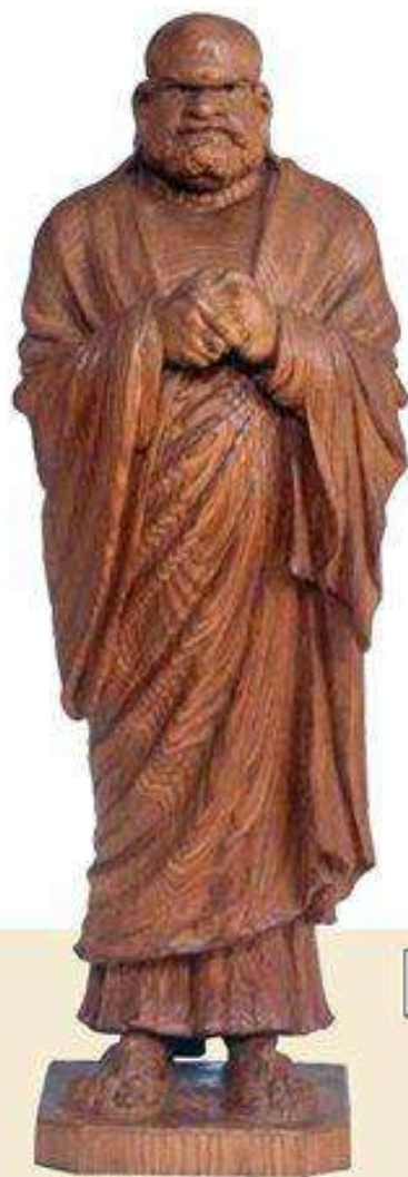
《摩訶達摩》 シービー化成株式会社 大正元年(1912)

岡山県井原市出身の彫刻家・平櫛田中(1872～1979)は、およそ一世紀にわたって日本近代彫刻史に大きな足跡をのこしました。井原市立田中美術館は、開館50周年記念特別展「没後40年 平櫛田中 美の軌跡」を開催し、その生涯と芸術を回顧します。