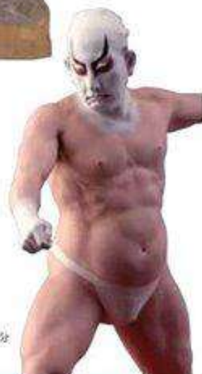
《鏡獅子試作複製》部分 井原市立田中美術館 制作年不詳