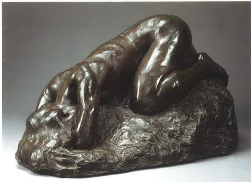
《デスベア》1909年(明治42) 公益財団法人碌山美術館蔵