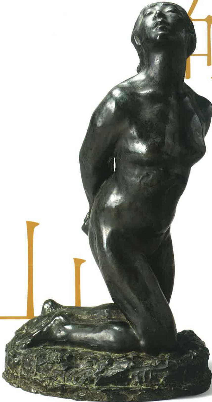
《女》1910年(明治43) 公益財団法人碌山美術館蔵