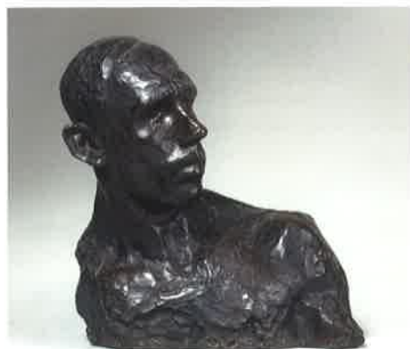
《坑夫》1907年(明治40) 公益財団法人碌山美術館蔵