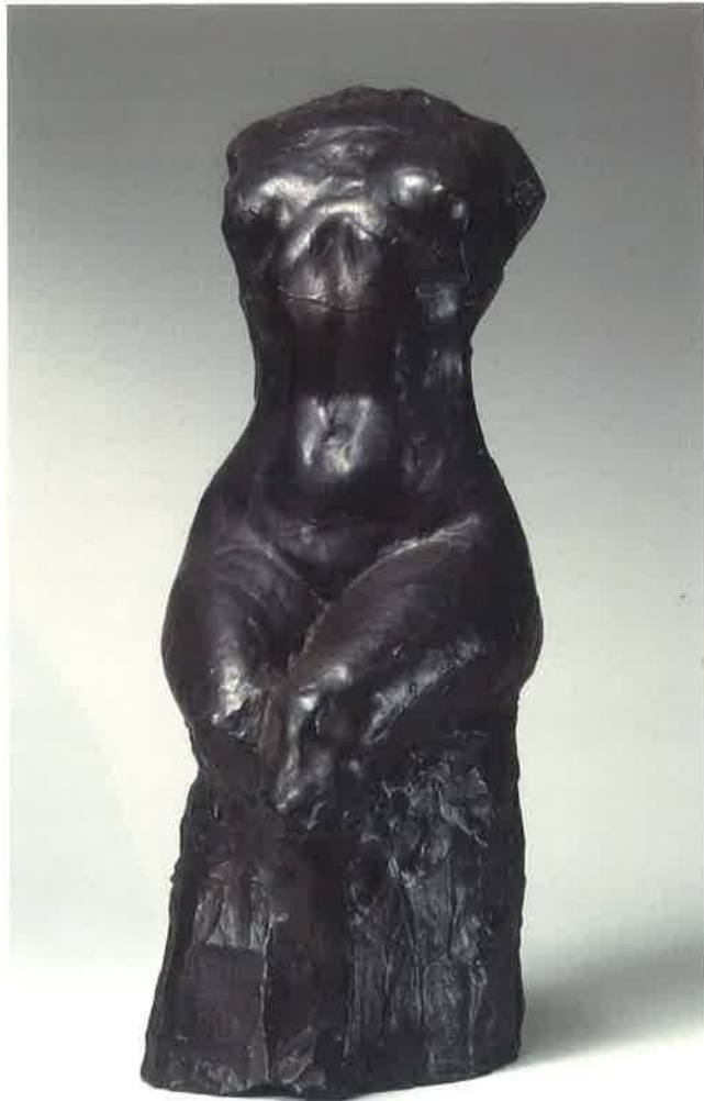
《女の胸》1907年(明治40) 公益財団法人碌山美術館蔵