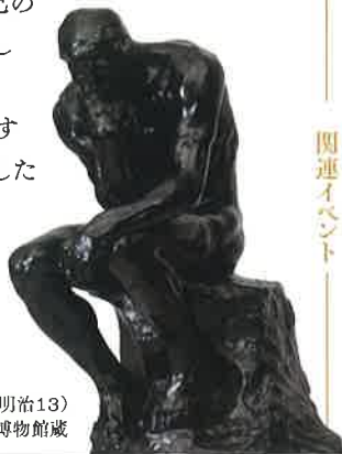
ロダン《考える人》1880年(明治13) おかざき世界子ども美術博物館蔵

本展では、荻原守衛の全彫刻15点を始めとするブロンズ、素描、油彩画を展示し、彼の追求した芸術を検証すると共に、同時代に活躍した彫刻家、画家の作品をご覧いただくことにより、明治後期から大正へと続く日本近代美術の流れをたどります。