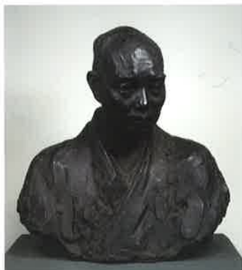
《北条虎吉胸像》1909年(明治42) 東京国立博物館蔵