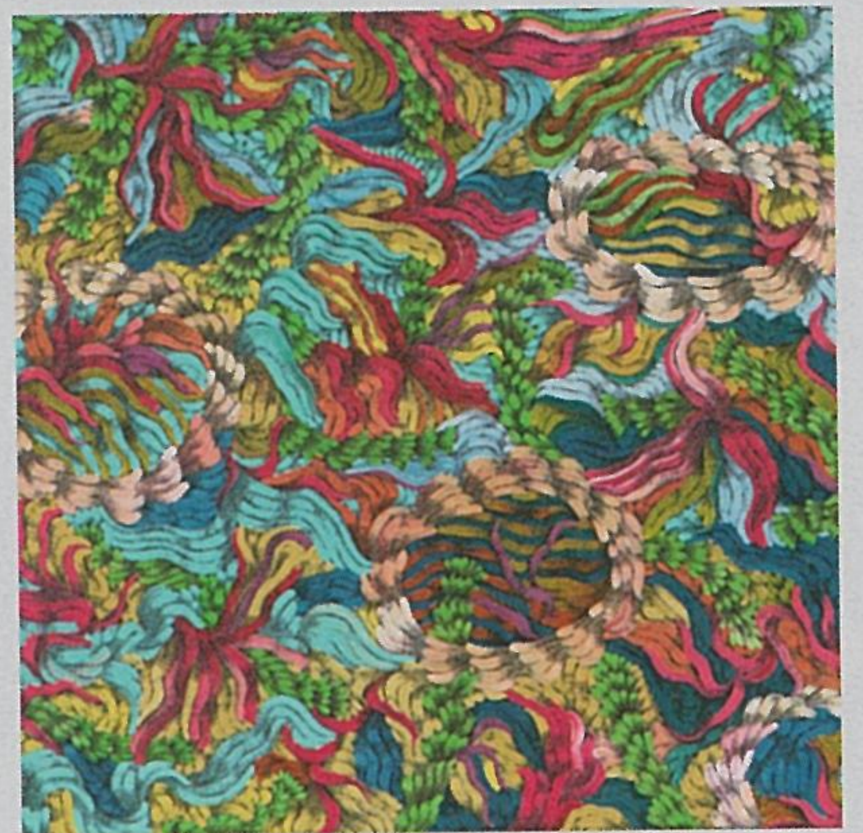
夜明け前 No.2 キャンバス・アクリル 23×16cm