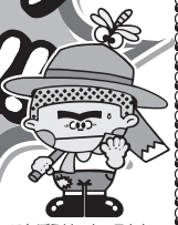
ごんぼう村のキャラクター「ごんぼう君」