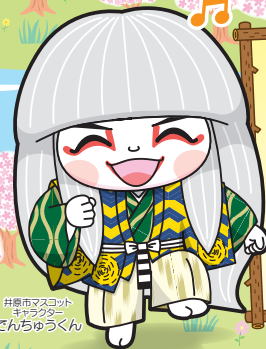
井原市マスコットキャラクターでんちゅつくん